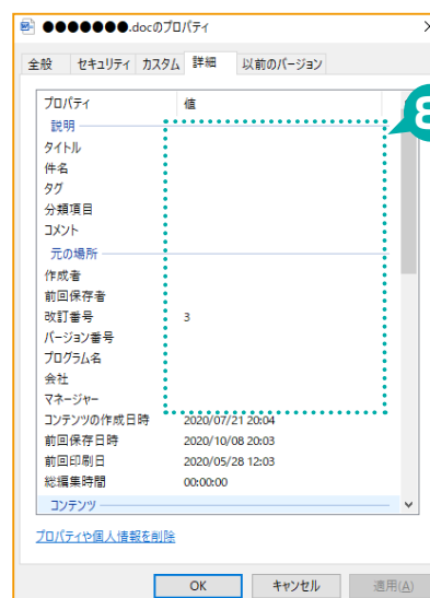
図4. プロパティや個人情報が削除されたプロパティ画面